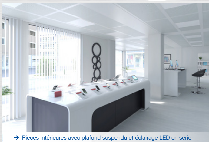
→ Pièces intérieures avec plafond suspendu et éclairage LED en série