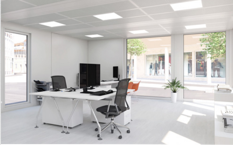
→ Pièces lumineuses grâce aux vitrages complets