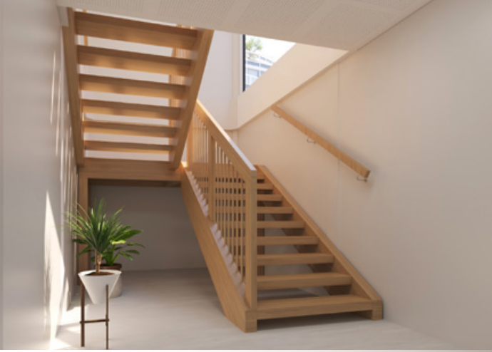
→ Escalier intérieur en bois massif