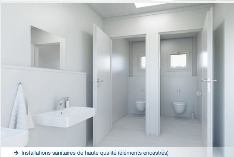
→ Installations sanitaires de haute qualité (éléments encastrés)